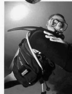
Action: Das Latitude bietet alles, was das Taucherherz begehrt

■ Seaquest ist unzweifelhaft ein traditionsreicher Jackethersteller mit ausgereiften Produkten, denn nicht umsonst blicken die Amerikaner, die zum Aqualung-Konzern gehören, auf eine mehr als 30-jährige Firmengeschichte zurück. Während die Marke bekannt dafür ist, Qualität zu liefern und dafür auch den angemessenen Preis zu verlangen, tritt das neue Latitude eher in andere Fußstapfen. Denn trotz eines Ladenpreises von nur 356 Euro kommt das Modell gut ausgestattet daher. Wem zwei Schnellablässe nicht genug sind, der kann für rund 20 Euro noch einen im Rücken nachrüsten. Vier Bleita-